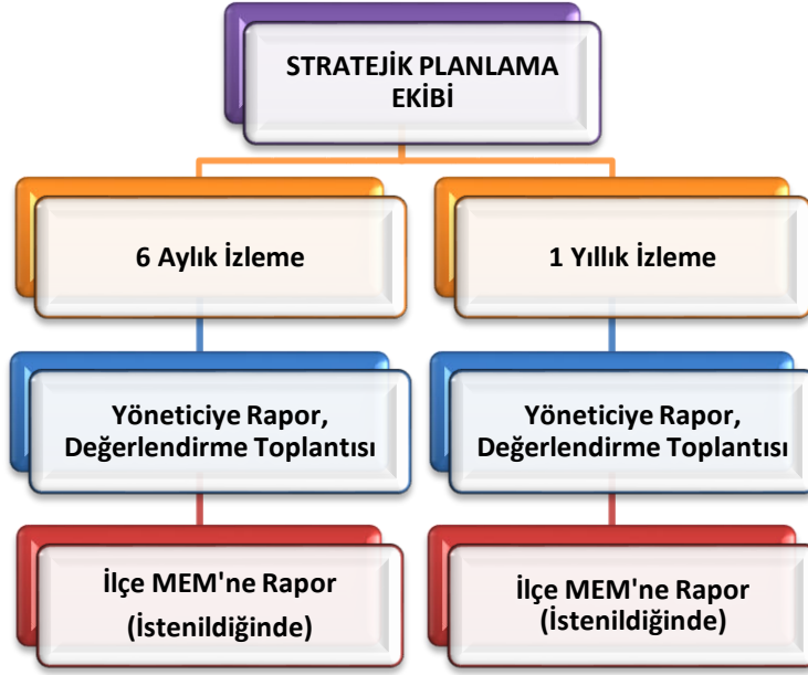
Şekil 8 Stratejik Plan İzleme ve Değerlendirme Modeli